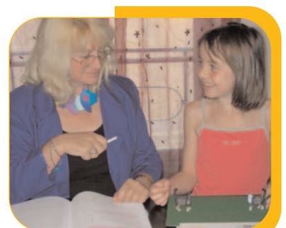
COMPRÉHENSION-LEXIQUE / Mots fonctionnels-topologie : relation spatiales