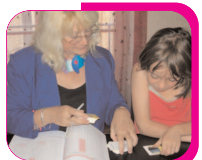
EXPRESSION-LEXIQUE / Concrets : Objets quotidiens, animaux, parties du corps