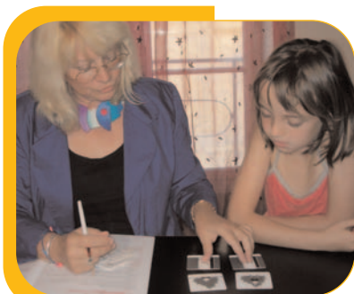
COMPRÉHENSION-LEXIQUE / Mots pleins-Abstrais : différence, opposition