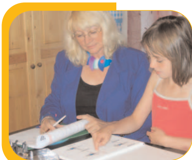
COMPREHENSION-MORPHOSYNTAXE / Oppositions morphologiques et syntaxiques (choix multiples)