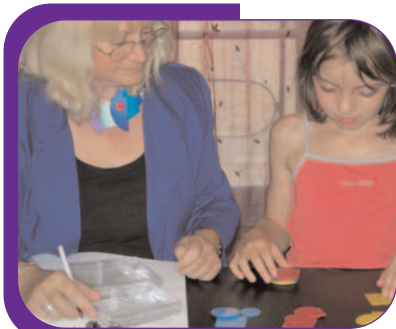
CAPACITÉS COGNITIVES / Classement en fonction d'un critère discret, "Jetons"