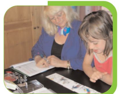
CAPACITÉS SÉMANTICO-PRAGMATIQUES / Compréhension de questions